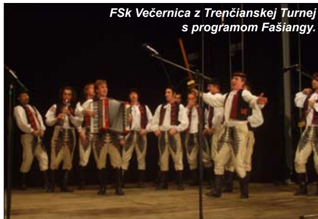
Fsk Večernica z Trenčianskej Turnej s programom Fašiangy.