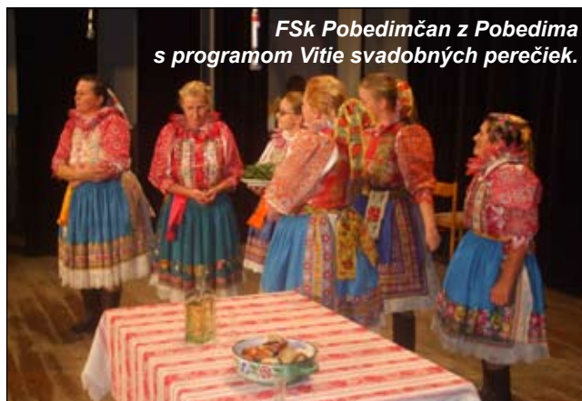
Fsk Pobodimčan z Pobodima s programom Víťie svadobných perečiek.