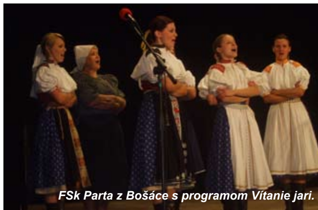
Fsk Parta z Bošáče s programom Víťanie jari.