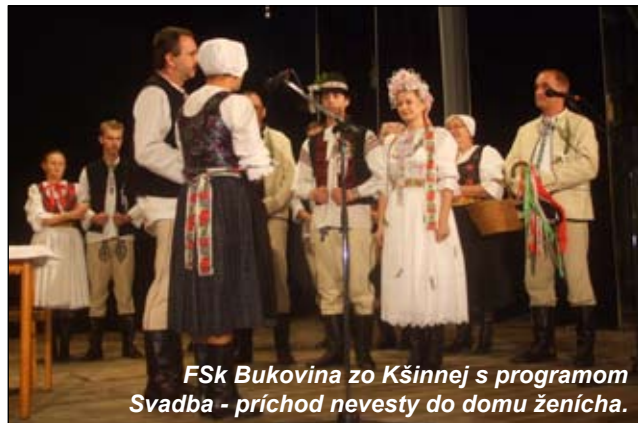
Fsk Bukovina zo Kšínnej s programom Svadba - príchod nevesty do domu ženicha.