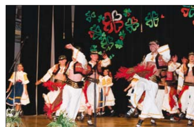
FŠ Partizán dvíhal zo stoličiek.