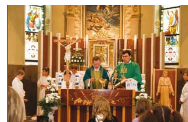
Slávnostná svätá omša.