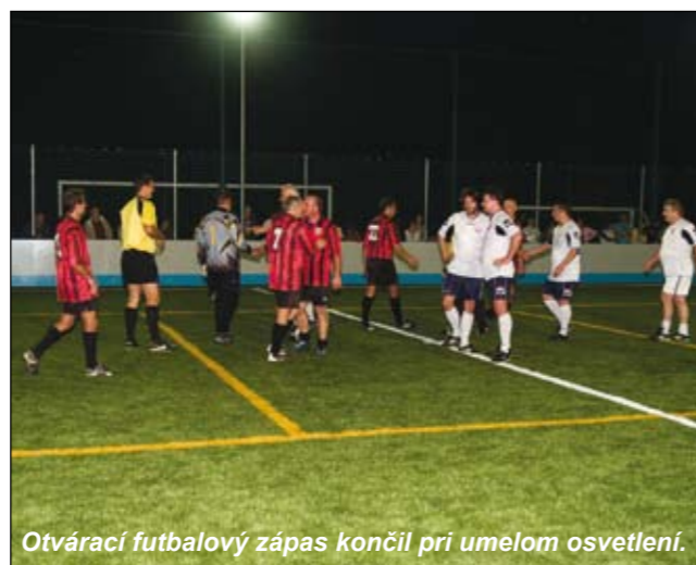
Otvárací futbalový zápas končil pri umelom osvetlení.