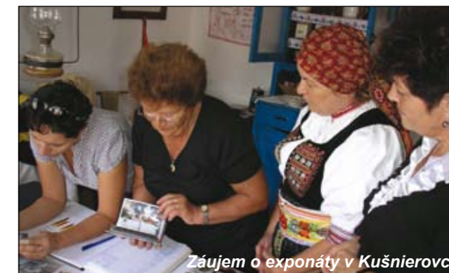
Záujem o exponáty v Kušnierovci.