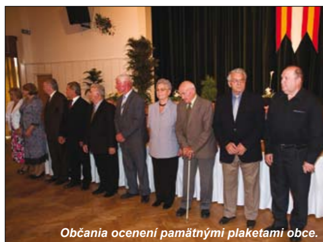
Občania ocenení pamätnými plaketami obce.