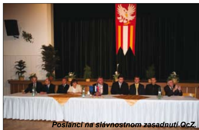
Poslanci na slávnostnom zasadnutí OcZ.