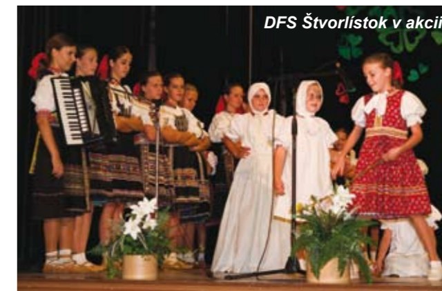
DFS Štvorlístok v akcii.