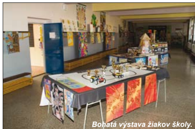
Bohatá výstava žiakov školy.