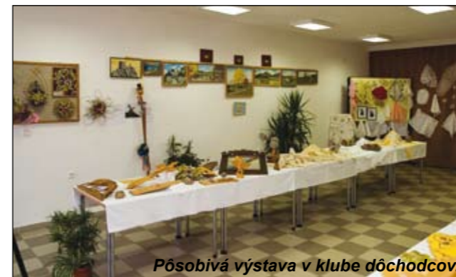
Pôsobivá výstava v klube dôchodcov.