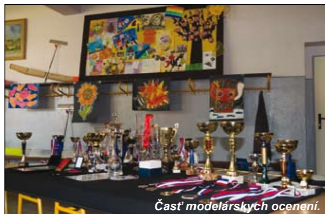
Časť modelárskych ocenení.