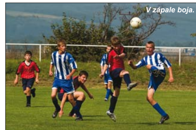
V zápale boja.