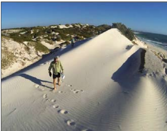
Stopy v „snehu“

Keď sme vyšli na vrchol duny lemujúcej pobrežie, oko nám potešila krásna panoráma. Priamo pred nami nič nerušilo pohľad na šírý prázdny oceán, pod nami sa doprava aj doľava rozbiehal oblúk rozľahlej bielej pláže. Jej piesky plynule prechádzali do širokanskej azúrovo modrej zátoky, ktorej vody sa decentne vlnili a trblietali na slnku. Z pravej strany oblúka bola ohraničená masívnou dunou a z ľavej členitou skalou. Prílivy a búrky ju rozbili a vytvorili v nej zaujímavé až tajomné zákutia, jaskynky, skalné okná a prielazy, sčasti vyplnené naviatym pieskom. Kráčali a šplhali sme sa hore chodníčkom, ktorý viedol pomedzi tieto prírodné skulptúry. Bosé nohy sa nám príjemne zabárali do jemného horúceho piesku, ktorým bol chodník vystlaný.