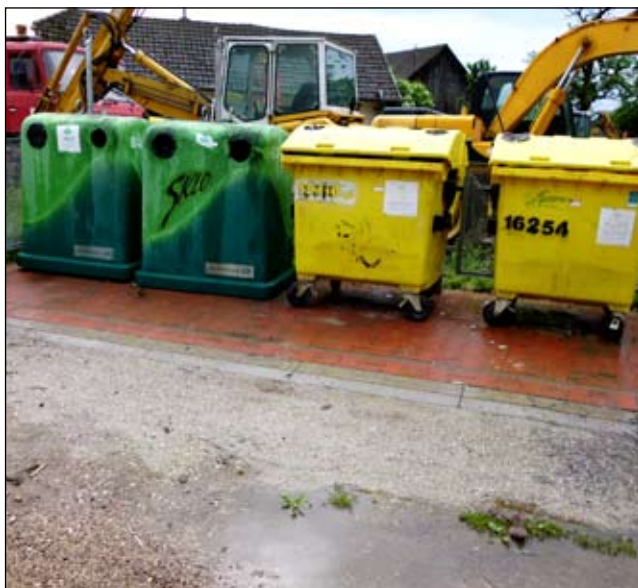
Obrázok 2: Stav po vyčistení.