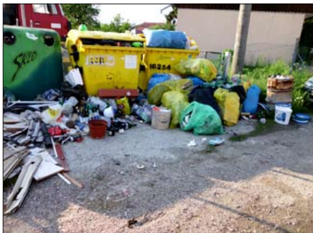
Obrázok 1: Stav pred 1. júnom.