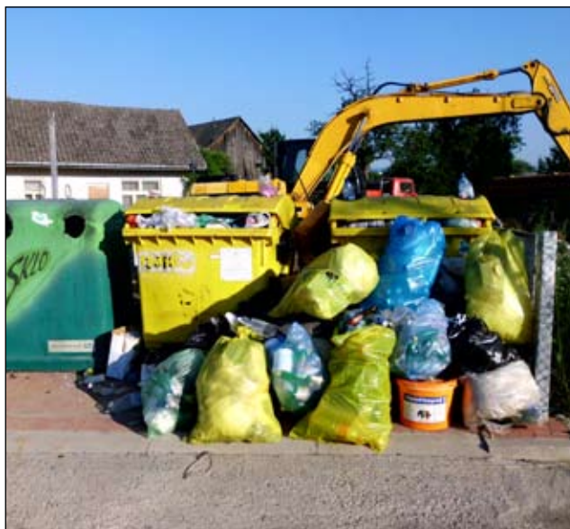
Obrázok 3: Stav po dvoch týždňoch od vyčistenia.